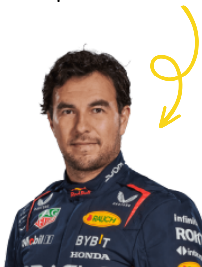
SERGIO PEREZ (#11)