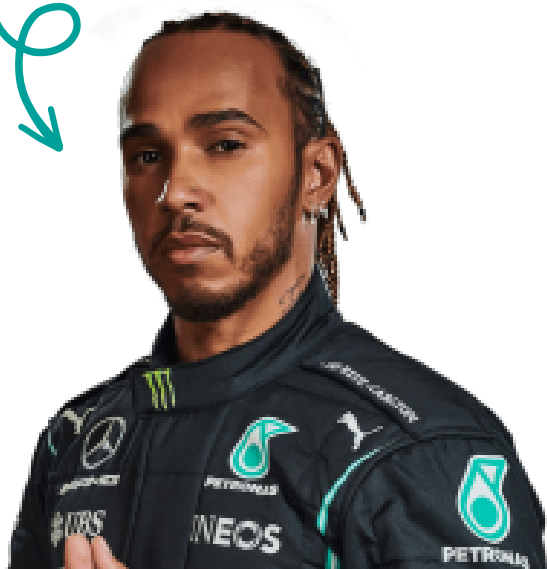
LEWIS HAMILTON (#44)

Conhecida por sua dominância , conquistando múltiplos campeonatos e estabelecendo-se como uma força imbatível .