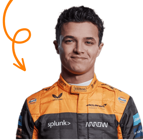
LANDO NORRIS (#4)

Combina um histórico rico em vitórias com inovação tecnológica .