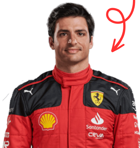
CARLOS SAINZ (#55)