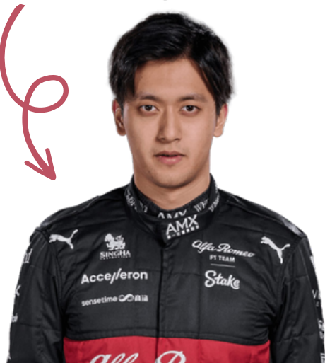
ZHOU GUANYU (#24)

Possui uma rica história e tradição no automobilismo.