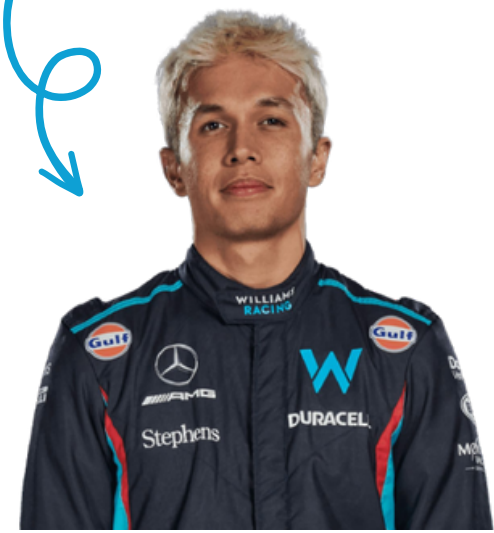
ALEXANDER ALBON (23)

Possui uma tradição de longa data no esporte, embora tenha enfrentado desafios recentes.