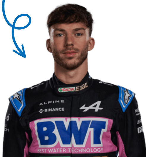
PIERRE GASLY (#10)