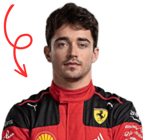
CHARLES LECLERC (#16)

Uma icônica equipe de corrida com um legado de vitórias e inovação no mundo automobilístico.