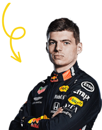
MAX VERSTAPPEN (#1)

Atualmente a número 1, é conhecida por seu desempenho competitivo e espírito inovador , tendo conquistado vários campeonatos mundiais.