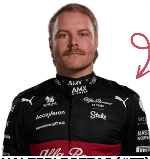
VALTERI BOTTAS (#77)